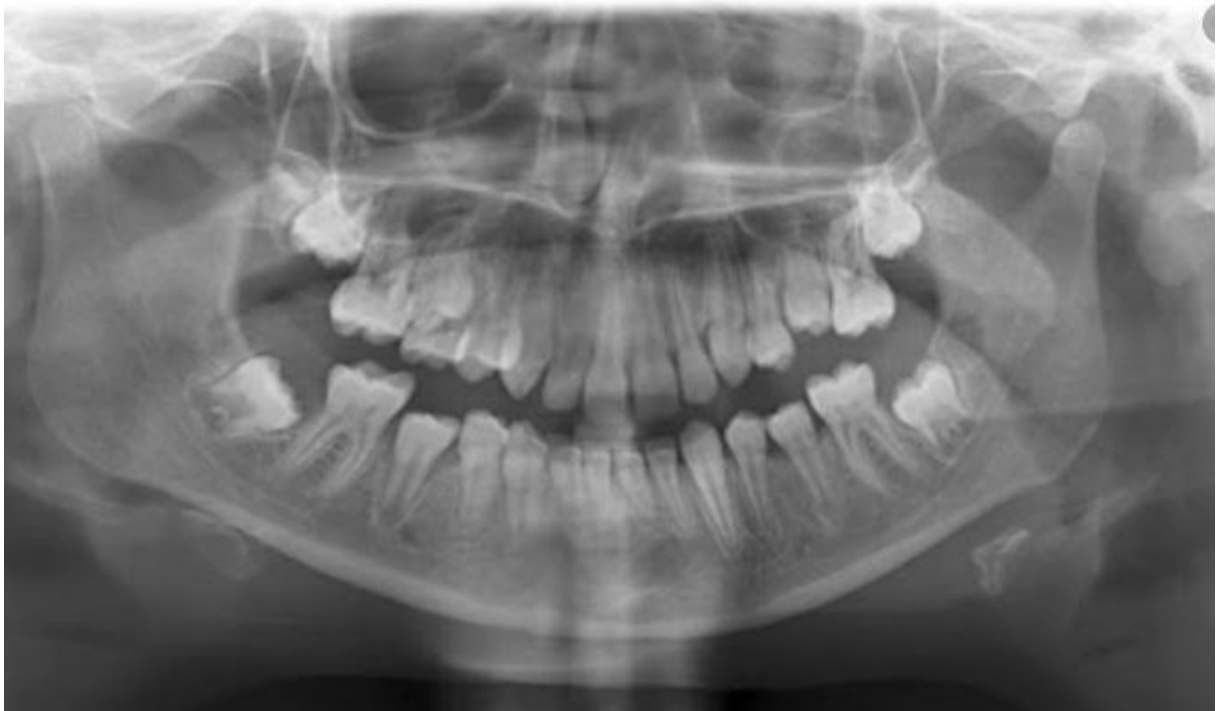
OPT beim Jugendlichen

Die Auswertung des FRS durch Vermessung verschiedener Punkte, Strecken und Winkel wird als Kephalometrie bezeichnet. Hier stehen über 100 verschiedene Analyseverfahren zur Verfügung, wobei die nach Ricketts oder Hasund am weitesten verbreitet sind. Da der Strahlengang nur nahezu parallel ist und der Film bzw. Sensor sich hinter dem Objekt befindet, wird das Objekt auf dem FRS in der Regel leicht vergrößert abgebildet. Durch den Einbau einer röntgenopaken Skale in die Nasenstütze wird eine nachträgliche Kalibrierung ermöglicht, so dass nicht nur Winkel, sondern auch Strecken in Millimetern gemessen werden können.